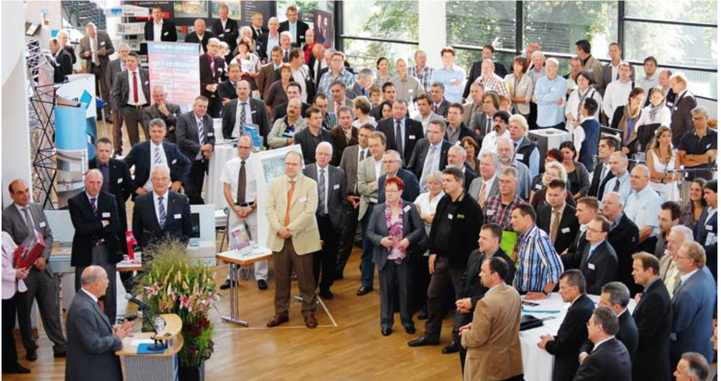
Viele Besucher und ein gut gelaunter Oberbürgermeister am Rednerpult: Ulms Stadtoberhaupt Ivo Gönner richtete ein launiges Grußwort an die Gäste.

akzeptiert, betonte er. Sie sollten dem Profi-Verleger ein schadenfreies Arbeiten ermöglichen, aber keine „Kochrezepte für Nichtfachbetriebe“ sein: Um mit ihnen arbeiten zu können, seien die Fachkenntnisse einer fundierten Ausbildung unerlässlich.