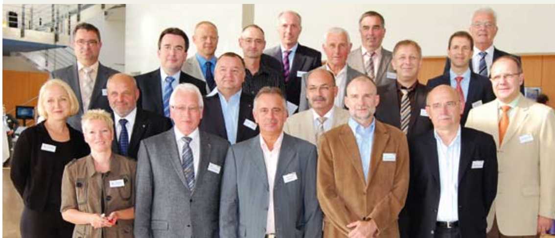
Haupt- und ehrenamtliche Interessenvertreter des Fliesengewerbes auf Bundes- und Landesebene trafen sich zu ihrer Jahrestagung in Ulm.

Im Rahmen der Deutschen Fliesentage 2011 fand in Ulm auch die Landesfachgruppenleiter-Sitzung statt. Hauptthemen waren die nach wie vor kontrovers diskutierte Novelle der Handwerksordnung und Möglichkeiten einer Qualifizierung als Marktzugang.