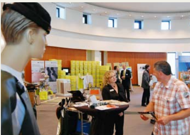
In der Fachschau zeigten zahlreiche Hersteller ihre Produkte.